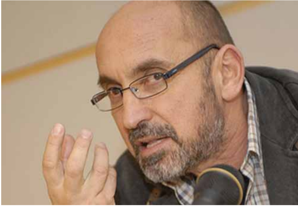
Nga Fatos Lubonja

Nuk ishte i papritur për mua numri i madh i reagimeve të atyre lexuesve që, pas shkrimit “Drejtësi – Demokraci”, m’u drejtuan duke më thënë se nuk rregullohet me paga të larta korrupsioni në Drejtësi, se 2000 euro në muaj nuk bëjnë punë, pasi këta janë mësuar me shumë më tepër, e më përmendnin pastaj, kush faktin se mjafton të shikosh se çfarë makinash kanë gjyqtarët e prokurorët tanë, kush se këta shpenzojnë deri 100 000 euro në vit vetëm për pushime, kush duke më treguar vilat e tyre e me radhë e me radhë. Nuk ishte e papritur edhe një ndjenjë nënshtrimi total ndaj këtij realiteti që shprehej në shumicën e këtyre reagimeve, ku, si ekstrem që puqet me nënshtrimin do të fusja edhe reagimet e egra të atyre që propozonin si zgjidhje efikase jo rritjen e pagave, por “dajakun”, “burgun”, “gijotinën”, duke harruar se në një demokraci “burgun” do të duhet ta vëndosin po të akuzuarit në fjalë.