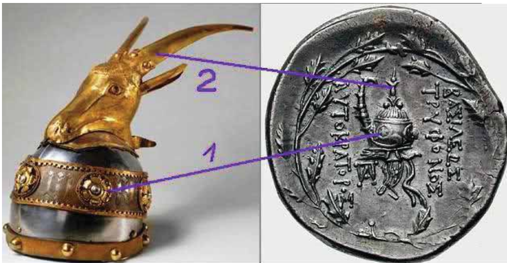
-2000 vjete diference, perseri te njejtat simbole, dhe e njejta perkrenare