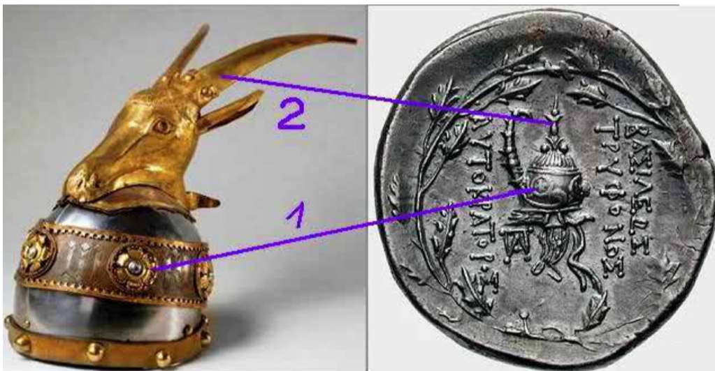
-2000 vjete diference, perseri te njejtat simbole, dhe e njejta perkrenare